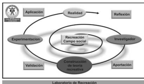
Gráfica 1. Metodología investigativa del Laboratorio del Recreo Humano de la U de Cundinamarca. Elaboración propia.

Lo que se puede interpretar la gráfica anterior pone en evidencia el interés de dejar de ver a la recreación como un simple ejercicio activista que se convierte en solo un dispositivo para la utilización del tiempo libre, para observarla como una de las mejores estrategias de construcción de lo humano y de transformación de lo social. Es precisamente desde este postulado que el Laboratorio del Recreo Humano pretende abordar los problemas y enfoques del campo desde donde se identificaran preguntas que serán las que guiaran su labor investigativa. Algunas son: ¿Cuál es el objeto de estudio de la recreación? ¿Desde dónde construir teoría recreativa? ¿Porque es importante la profesionalización de los agentes que participan en el campo? ¿Cuáles son las tendencias actuales recreativas? ¿Por qué no existe una cultura de la recreación? ¿Qué aporte brinda la recreación a los otros campos del conocimiento?